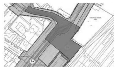
Auto-Tiefgarage mit anderer Auffahrt Grafik: OVA/146/2023/18.10.23XY, Bearbeitung: U.Schürfeld

Wohin also mit den vierrädrigen Blechkisten? In eine Tiefgarage, die wirklich groß genug ist, um sowohl den Besucherverkehr des