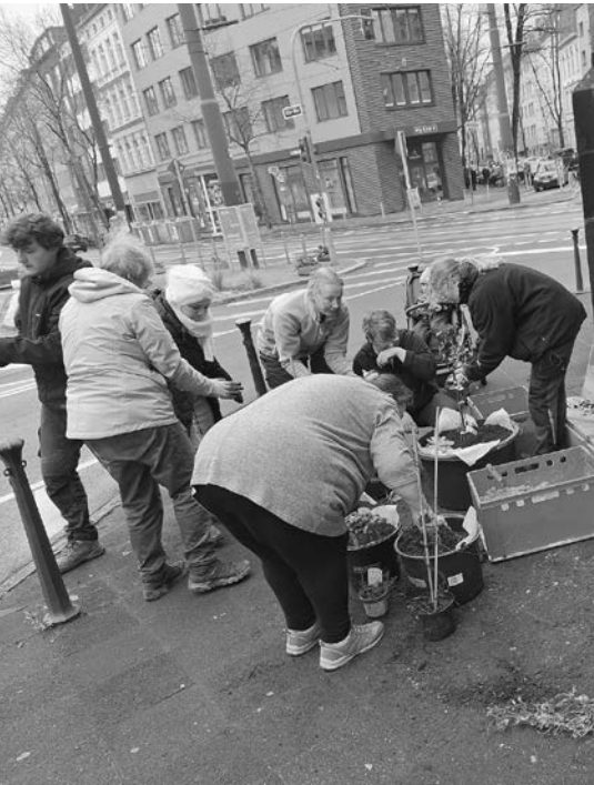
Zusammen etwas zu bewirken macht Spaß

check in Kirchengemeinden“ (siehe auch grünstift 1/2024, S.18) unterstützt die Biostation Haus Bürgel eine Ehrenamtsinitiative der katholischen Gemeinde St. Martin: Zusammen wollen wir einen kleinen Beitrag zur Stadtnatur leisten. Aufwendige Umgestaltungsmaßnahmen sind in die-