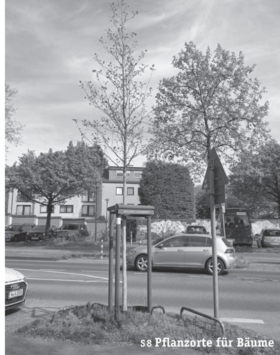
s8 Pflanzorte für Bäume