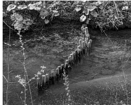
Einbau mit Folgen: Stillwasser und Verlandung

Ein Spaziergang an der Düssel in Bilk lohnt sich! Text und Foto: Birgit Höfer