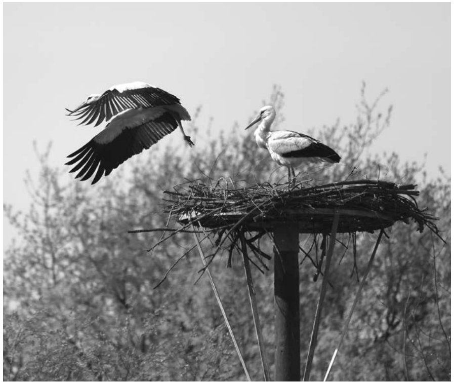
Hier ist noch einiges zu tun am Nest

In unserem Leitbild haben wir unsere Vision von einer Welt formuliert, in der sich jeder Mensch als Teil des großen Netzwerks des Lebens auf unserem Planeten versteht. Unseren Beitrag für den Umgang mit den Herausforderungen des Klimawandels und des Artenschwunds sehen wir in der Stärkung und Wiederherstellung möglichst intakter, naturnaher Lebensräume und dem