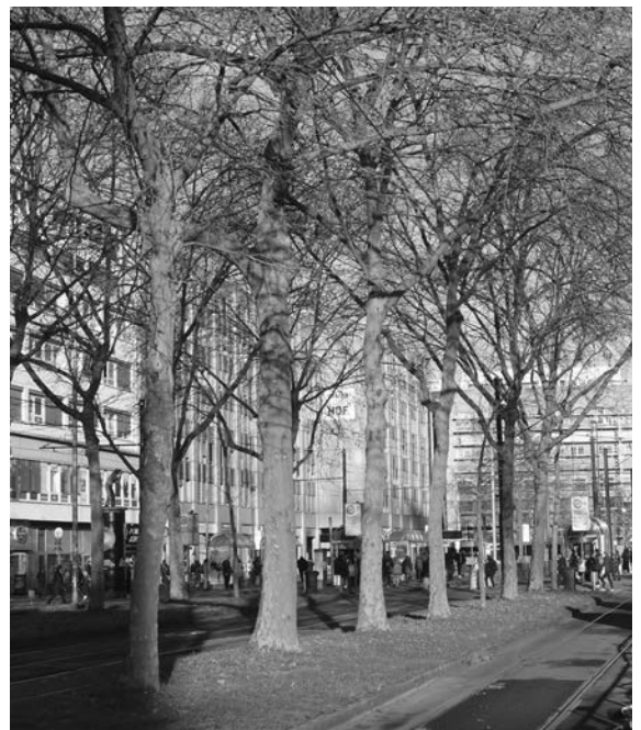
Eine der Platanenreihen im Süden des KAP, die wegen der neuen Streckenführung der Rheinbahn gefällt werden sollen.

ganzen Platz autofrei machen. Kein Auto darf nach dem Umbau mehr benötigt werden, auf den Platz zu fahren und dort zweifelt nach einem Parkplatz zu suchen. Daher habe ich die Forderung aufgestellt, dass keine oberirdischen Parkplätze vor dem Hauptbahnhofgebäude eingerichtet werden dürfen. Der ganze KAP vom Nord- bis zum Südeingang bis zur Bundespolizei im Süden muss dem Fußverkehr vorbehalten bleiben. Nur in den Bereichen, in denen die Straßenbahn kreuzt oder die Stadt- und