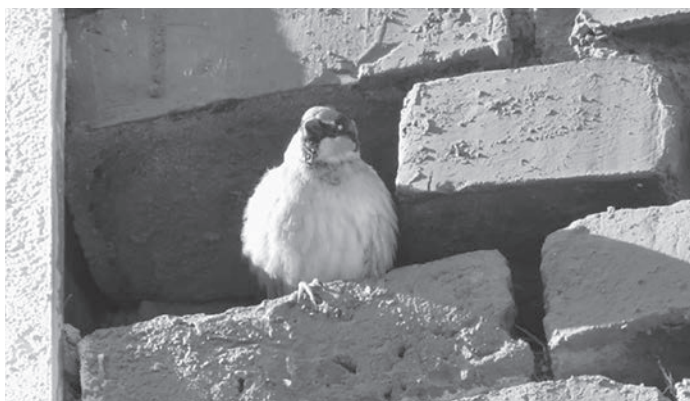
Solche Nischen liebt der Spatz

Spatzen lieben wilde Ecken mit Wildpflanzen, unordentliche Gärten ohne Pflanzen- und Insektenvernichtungsmittel, Brachflächen und dichte Hausbegrünungen. Für die tägliche Gefiederpflege brauchen sie Sandbäder und frisches Wasser. Nötig sind auch Nistmöglichkeiten für mehrere Spatzenpaare, denn sie nisten am liebsten mit vielen Nachbarn gemeinsam. Sie sind nicht nur ihrem Standort treu, sondern auch ihrem Spatzenpartner. In der Regel hält die Spatzenehe ein Leben lang, das in der Regel drei bis fünf Jahre dauert, in seltenen Fällen auch bis zu zwölf Jahre.