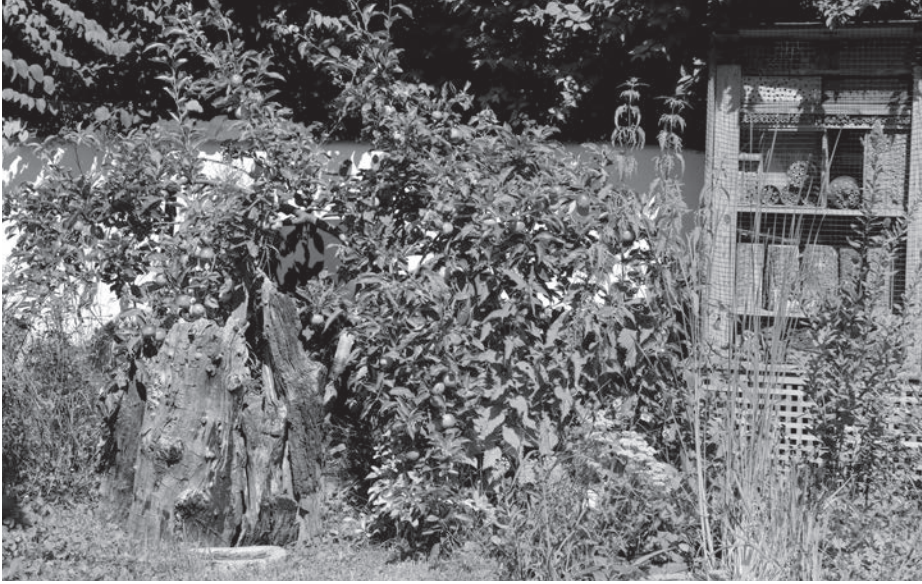
Wilde Ecke bei den Schaars