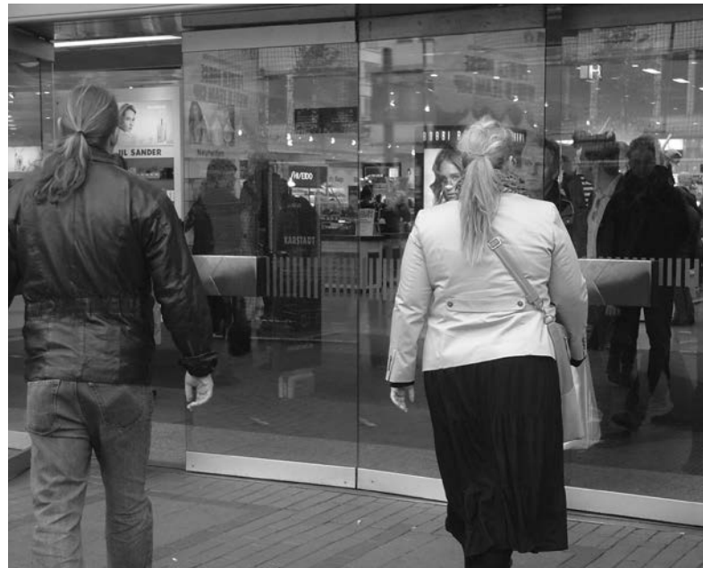
Einladung zum Kleiderkauf

Zunehmend bedeutsam muss das Recycling von Textilien werden. Sogenanntes mechanische Recycling (aus alten Textilien Fasern gewinnen) ist schwierig und meist qualitätsmindernd, vor allem bei Mischgeweben. Thermisches und chemisches Recycling sind erfolgversprechender, aber in der Regel kostspieliger. Hier ist ein zukunftsorientiertes Feld für Forscher:innen