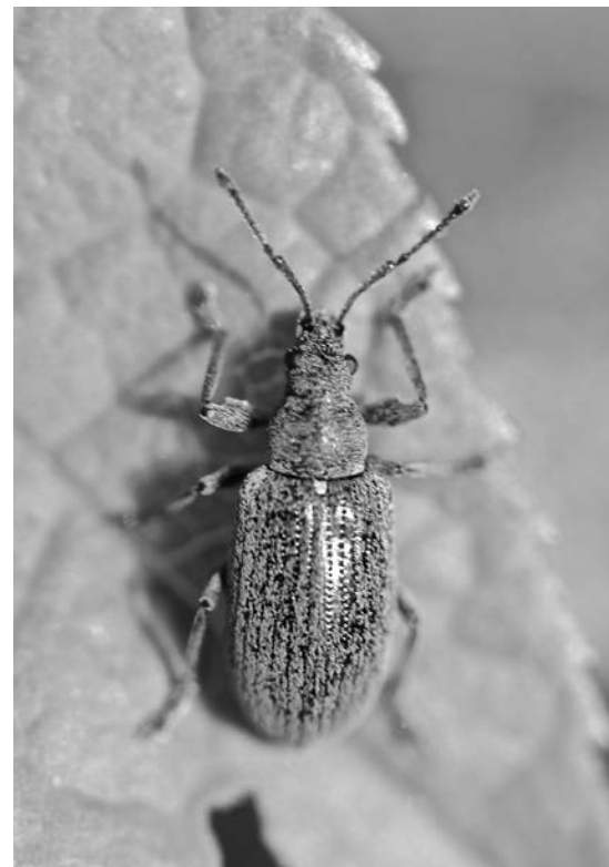
Rüsselkäfer lieben heimische Kost

der Unterseite der Blätter erhalten bleibt. Ab Mai beginnt der Baum dann zu blühen; die kleinen cremefarbenen Blüten stehen dicht in halbkugeligen Scheindolden und riechen etwas streng. Und ab September sind kleine orangefarbene bis dunkelrote