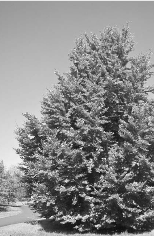
Junge Rotbuche - vielleicht schon angepasst?