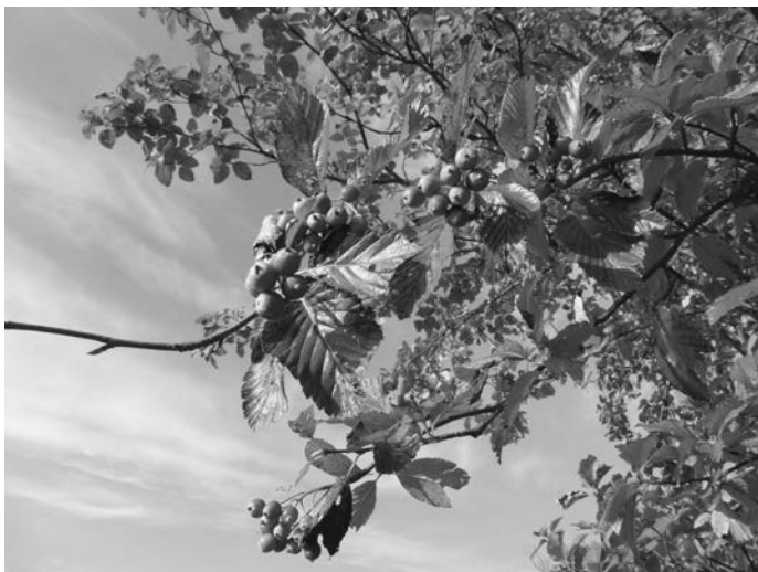
Früchte Anfang Herbst

der Unterseite der Blätter erhalten bleibt. Ab Mai beginnt der Baum dann zu blühen; die kleinen cremefarbenen Blüten stehen dicht in halbkugeligen Scheindolden und riechen etwas streng. Und ab September sind kleine orangefarbene bis dunkelrote