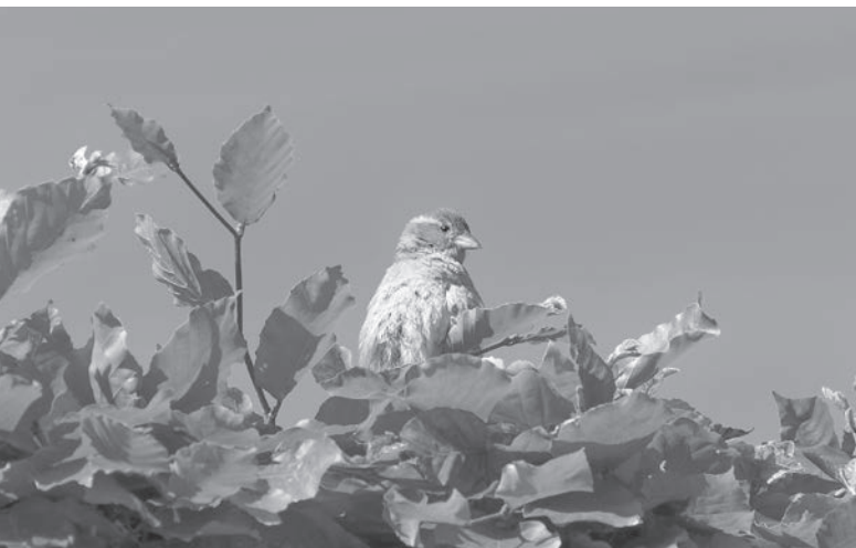
Spatz auf der Buchenhecke