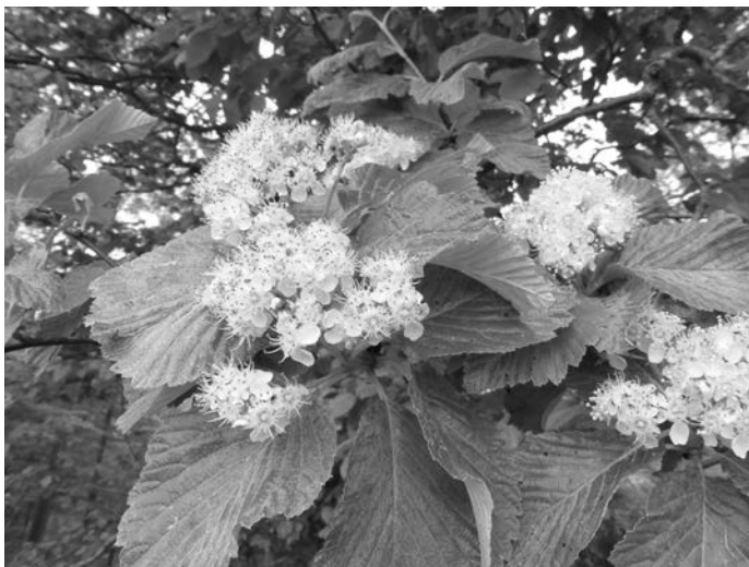
Blüten im Frühjahr

Blatt- und Rüsselkäfer, Wildbienen, Pflanzenwespen, Schmetterlinge, Wanzen und Zikaden – viele Insekten leben an Gehölzen und ernähren sich von ihnen. Diese Arten sind wiederum Nahrung für andere Insekten; weitere Arten ernähren sich von dort vorkommenden Pilzen, Algen, Flechten, Moosen oder toter organischer Substanz. Rund ein Drittel unserer rund 33.000 Insekten ist direkt oder indirekt von heimi-