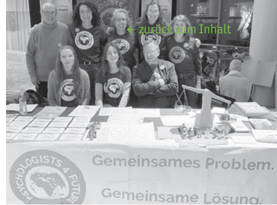
Acht Mitglieder der neuen Regionalgruppe

Die „Psychologists/Psychotherapists for Future“ (Psy4F) setzen sich dafür ein, dass wir uns der Klimakrise bewusstwerden, mit