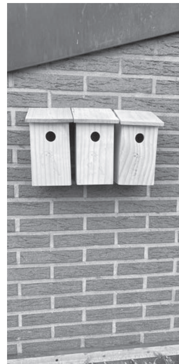
Die Wohnungen sind bezugsfertig