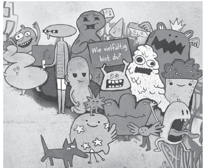
„Wie vielfältig bist du?“ fragt das DASA Grafik: DASA

Kaffee und selbstgebackene Kuchen, Gebrilltes, Vegetarisches und Salate zu zivilen