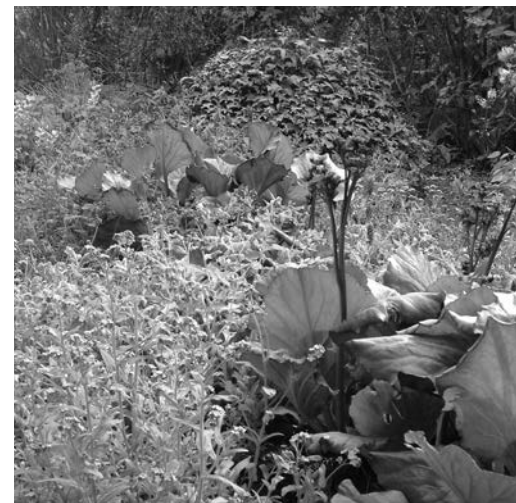
Kein Boden mehr zu sehen