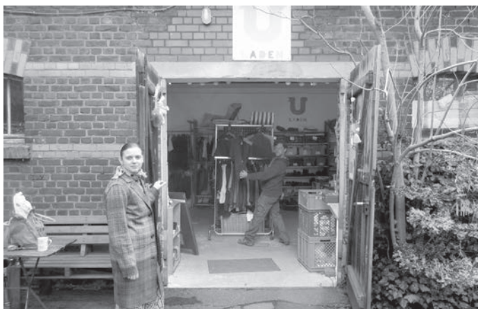
Hier geht's rein in den U-Laden