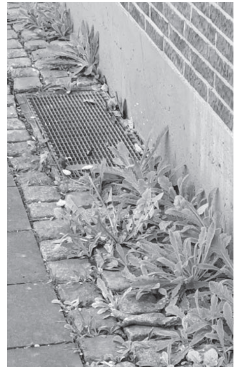
„Mini-Vorgarten“ auf dem Bürgersteig

Seit 2003 gibt es den Unkraut-Ehrentag. Denn das meist unerwünschte Beikraut in Gärten und Feldern ist wichtig im Naturkreislauf. Es bedeckt den Boden und schützt ihn vor Erosion, dient Wildbienen und anderen Arten als Nahrung und Unterschlupf. Da-