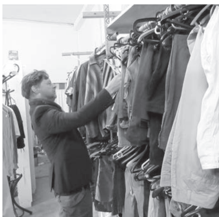
Da sollte doch was zu finden sein