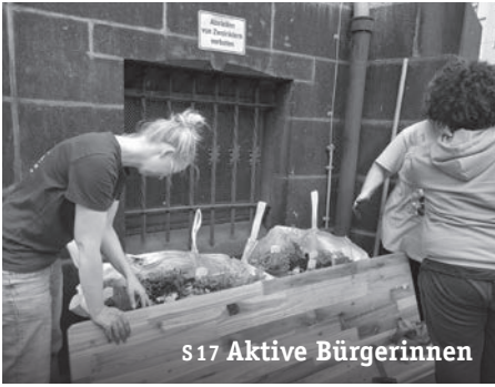
s17 Aktive Bürgerinnen