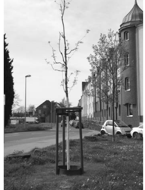
Hier in Hamm wurde ein Jungbaum gepflanzt

Dass es in einem städtisch geprägten Umfeld schwierig sein würde, neue Pflanzorte zu finden, war allen Beteiligten von vornherein klar. Denn da ist zu beachten: 1,50 m Abstand zu Grundstückszufahrten, ausgehend vom abgesenkten Bordstein; 5 m Abstand zu Straßenlaternen; bei Errichtung einer Baumscheibe (etwa 2 m Breite) muss noch eine Gehwegbreite von mindestens 1,80 m für Fußgänger:innen gewährleistet sein; 2 m Abstand zum Straßenkanal (zu erkennen z.B. an Gullideckeln); Hydranten, Schieberklappen usw. sind freizuhalten; Abstand zu Strom-, Gas- und Telekommunikationsleitungen; Feuerwehrbewegungszone. Abstände zu Straßenlaternen sind auch für Laien erkennbar – unterirdische Leitungsführungen werden im „Umlaufverfahren“ zwischen den Ämtern und den Leitungsträgern abgeklärt. Hier hilft der Augenschein vor Ort nicht. So erklärt sich die oben ge-