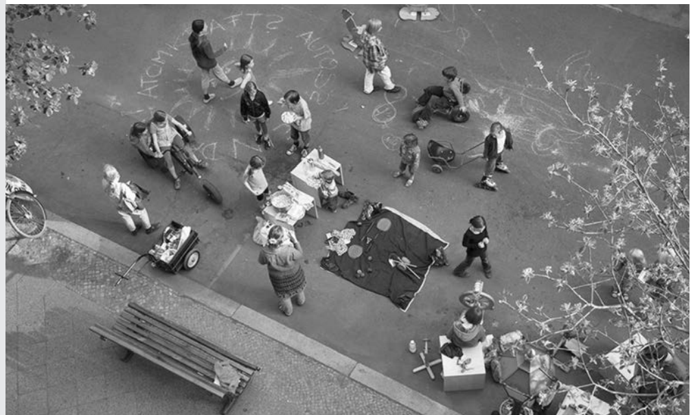
Auch so kann öffentlicher Straßenraum genutzt werden

Mehr, breitere und komfortablere Verkehrswege und Begegnungszonen für Fußgänger:innen und Radfahrer:innen im Stadtraum einrichten; Vorrechtsregelungen für den