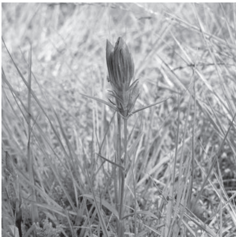
Further Moor zur Blütezeit des Schmalblättrigen Wollgrases

Torfmoos- Knabenkraut findet sich auch in Übergangsmooren (unten)