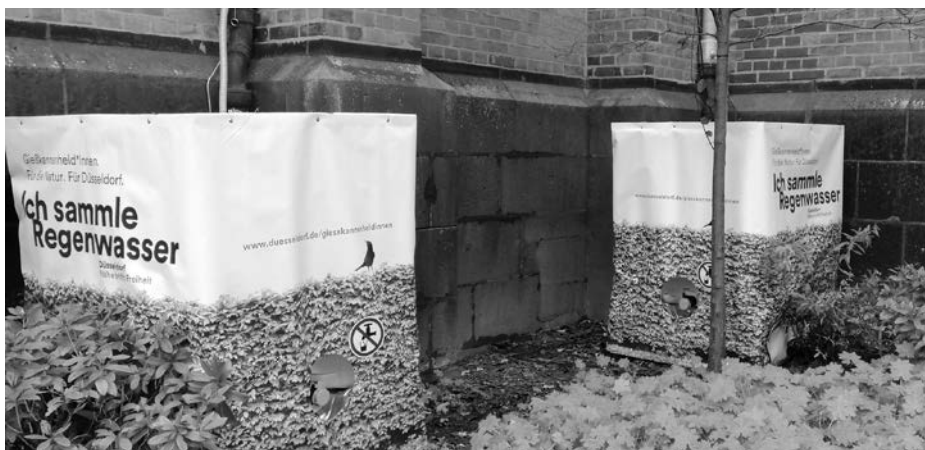
Regenbehälter an St.Martin in Bilk

www.duesseldorf.de/aktuelles , Lika Weingarten