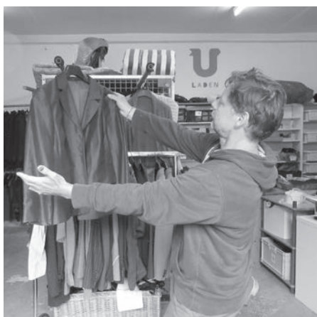
Das wär's doch!