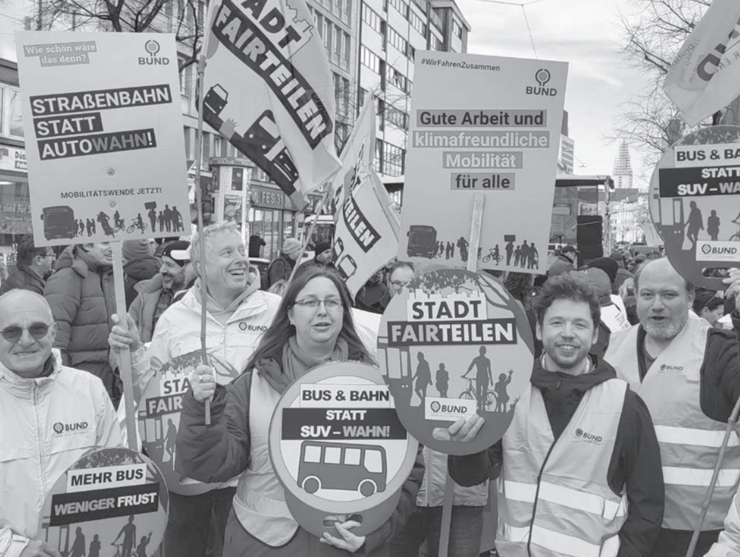
Auf der Straße für die Verkehrswende