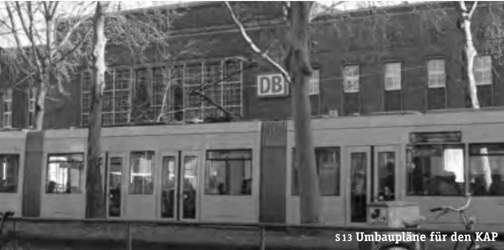
s 13 Umbaupläne für den KAP