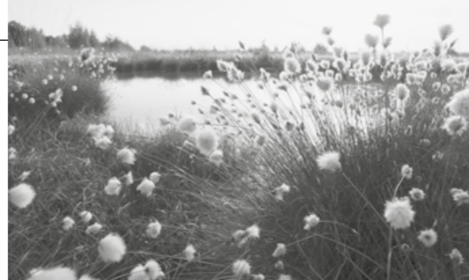
Das Moor mit seinem Scheiden-Wollgras ...

Auf ihren Reisen in unsere Moore ist sie den unterschiedlichsten Bewohnern begegnet: dem klitzekleinen Sonnentau, der Insekten mit dem Versprechen von Tautropfen in seine klebrigen Fallen lockt, den Kranichen, die laut trompetend mit ihren Partnern über das