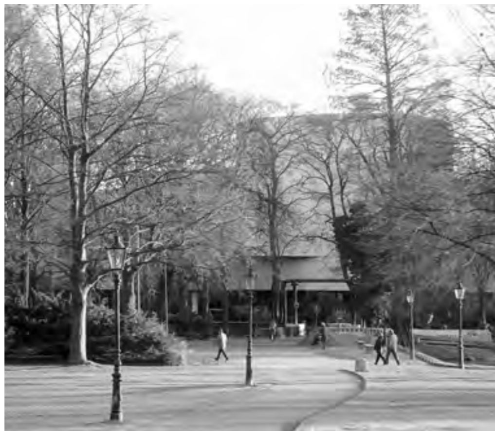
Bäume am Schauspielhaus

Erfreulich auch die Information, dass finanzielle Mittel („Baumbudget“) für die nächsten Jahre kontinuierlich zur Verfügung