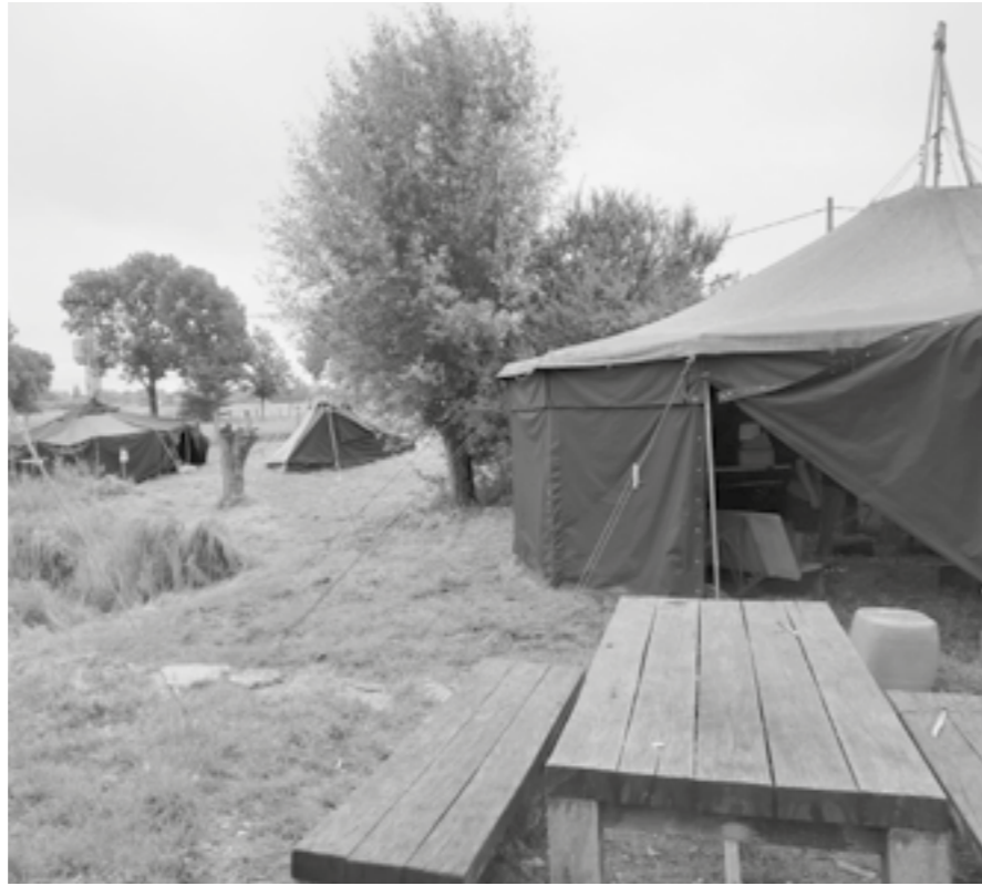
Im Klimalager – übernachtet wird im Zelt

Amphibien gehören zu den Tierarten, die durch den Artenschwund bisher besonders betroffen sind. In unserem Projekt „Klasse