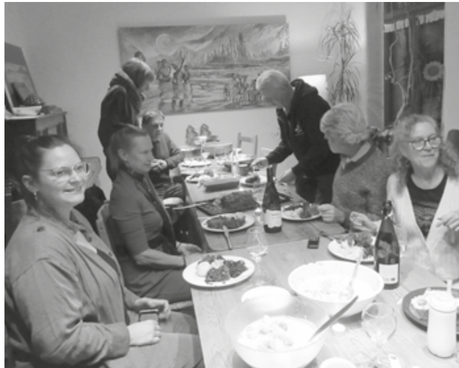
Veggie-Mittagstisch im Niemandsland