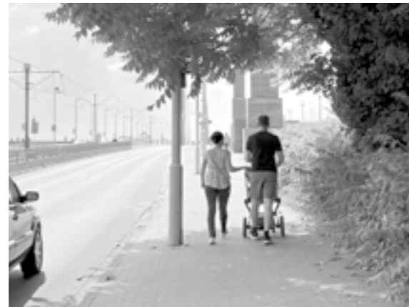
Hofgartenrampe: zu enger kombinierter Rad- und Fußweg

Aufteilung der Straße aber „zementiert“: Neue Radwege anstelle von Parkplätzen wären nur noch möglich, wenn Bäume gefällt werden. So werden Optionen verbaut. Ein anderes Beispiel an der Cecilienallee. Dort gibt es Querparkplätze zwischen Fahrbahn und der Promenade. Ziel sollte es sein, den Radverkehr vom Fußverkehr zu trennen. Eine Möglichkeit ist es, die Querparkplätze aufzugeben und dort eine Radverkehrsanlage für beide Richtungen zu bauen. Das wird jetzt deutlich schwieriger, weil man eine Toilettenanlage in der Flucht der Querparkstände errichtet hat. Bäume oder eine Toilettenanlage sind wichtig. Aber hätte man nicht vorher überlegen sollen, ja müssen, wie man den