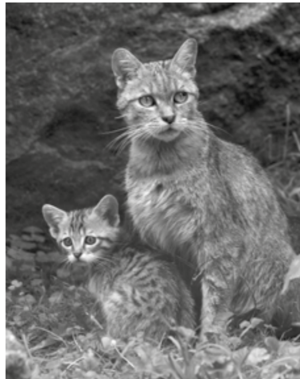
Die Wildkatze braucht Lebensräume

In den Kernzonen der Nationalparks (in NRW: „Nationalpark Eifel“) darf die Natur ihre eigenen Dynamiken und Gesetze entwickeln. Wildlebende Pflanzen- und Tierarten stehen großflächige Rückzugsgebiete zur Verfügung. Entwicklungszonen werden reguliert und sollen später in Kernzonen übergehen. Naturschutzzentren ermöglichen Umweltbeobachtung und Umweltbildung, um die Natur zu einem Erlebnisraum für Menschen zu machen. (1,1 Mio Besucher 2021 im NP Eifel) Biosphärenreservate (kein BSR in NRW) sind Modellregionen mit vom Menschen