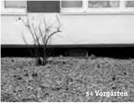
s 4 Vorgärten