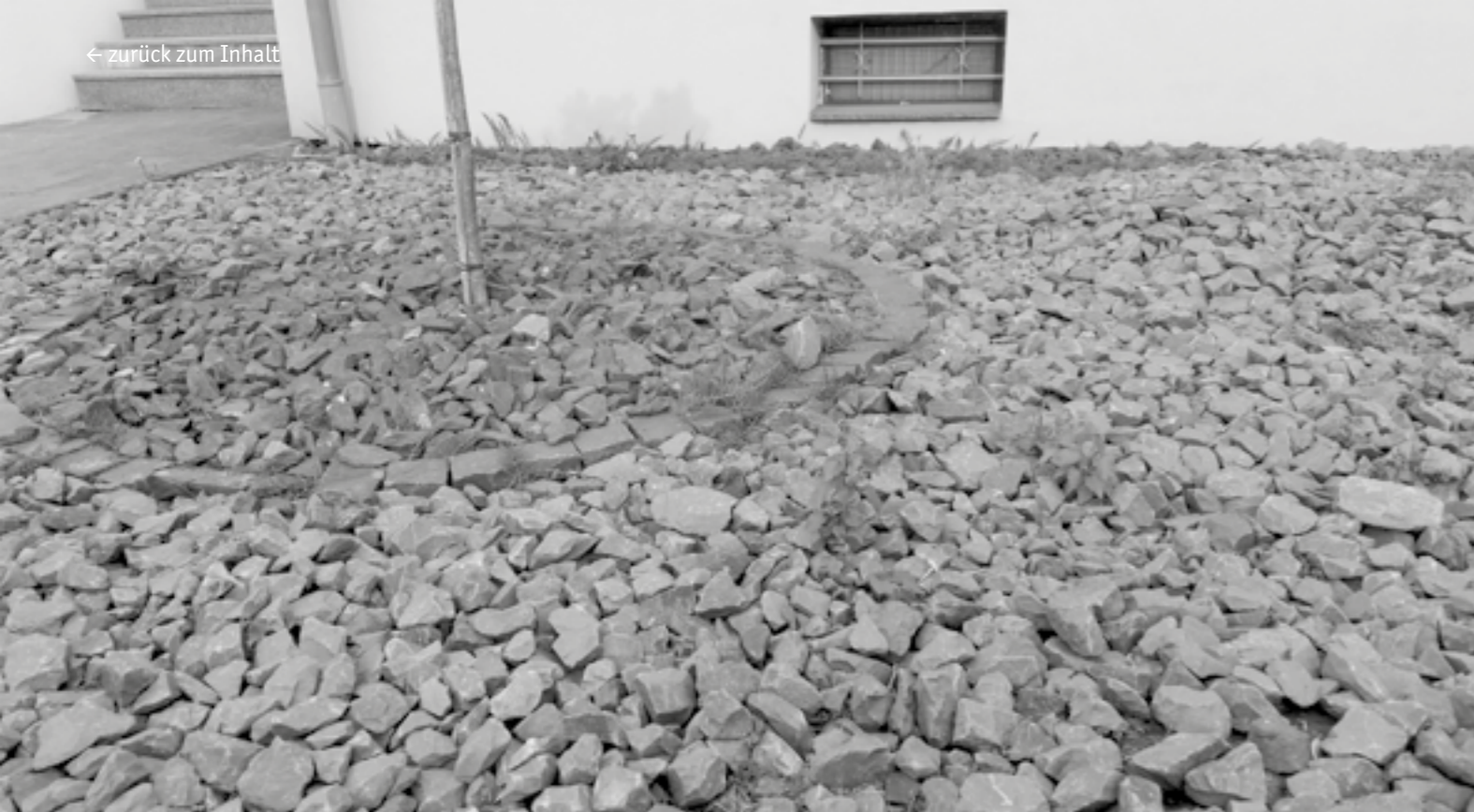
In die Jahre gekommener Schottergarten – gar nicht mehr pflegeleicht.