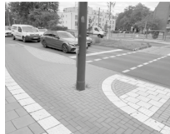
Karl-Geusen-Straße: Mast im Fahrradweg

größeren Staus. Was spricht dagegen, hier gleich nach Ende der Bauarbeiten auf dem rechten Fahrstreifen zunächst provisorisch Radspuren einzurichten? Die Roßstraße wird in jedem Fahrradklimatest als Horror