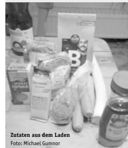
Zutaten aus dem Laden

Wurzelgemüse schneiden. 20 Minuten in etwas Wasser köcheln lassen. Gewürze und das Mandelmus einrühren. Fertig!