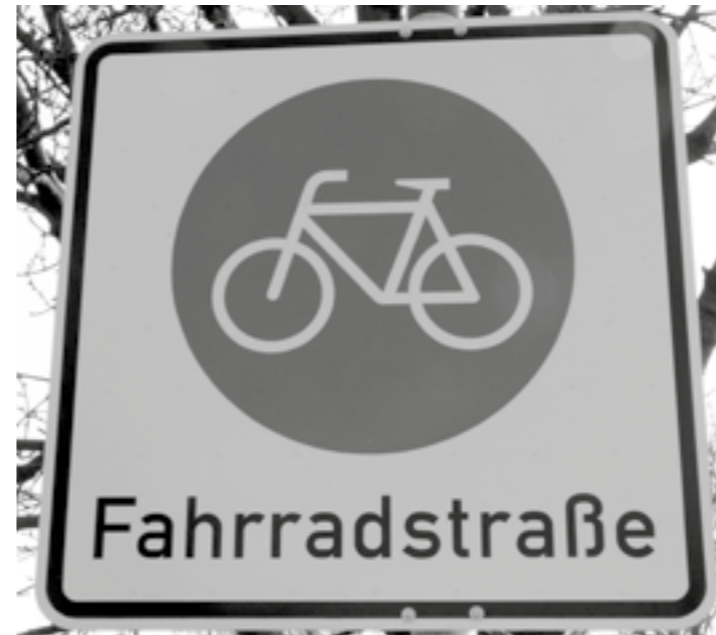
Hier gibt es eine Fahrradstraße

Fahrradstraßen. Entsprechende Planungen für die Limburg- und Gutenbergstraße in Grafenberg sind allerdings auf Proteste von Anwohner:innen gestoßen. Das Argument dort: Viel und schneller Radverkehr würde die Verkehrssicherheit gefährden. Eine politische Beschlussfassung darüber steht bisher aus. Die nächste Fahrradstraße in Düsseldorf wird also vermutlich „Am Wehrhahn“ auf dem Abschnitt von der Oststraße bis zur Jacobistraße werden – also nur ein recht kurzes Stück. Dort soll aber in absehbarer Zeit auch die „Radleitrouten 2 / West-Ost“ durchführen, die als komfortable und durchgehende Verbindung für den Radverkehr von Lörick über Hansa-, Lueg- und Maximilian-Weyhe-Allee, Jäger- und Jacobistraße, Grafenberger Allee, Caranachstraße, Hellweg und Dreherstraße nach Gerresheim geplant wird.