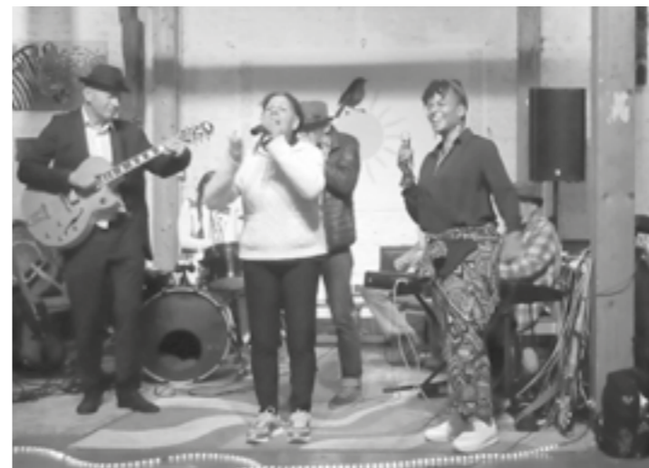
Jam Session anlässlich 25 Jahre Solaris

Am 4. und 5. August hat das Kulturcafé Solaris 53 e.V. sein 25 jähriges Bestehen in Form einer Jubiläums-Veranstaltung bei uns abgehalten. Es gab viele Konzerte, gutes Essen und mehr.