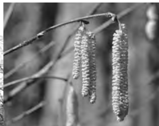
Kätzchen – mit Millionen Pollenkörnern

ein wichtiges Winterfutter. Viele Tiere legen mit den Nüssen Winter-Depots an – und vergessen dann einige ihrer Verstecke. Aus ihnen wächst dann die nächste Generation von Haselnusssträuchern. Die im Handel erhältlichen Haselnüsse stammen übrigens meist nicht von der gemeinen Hasel ( Corylus avellana ) ab, sondern von der südosteuropäischen Lamberts-Hasel ( Corylus maxima ). Wegen der roten Blätter wird sie auch Bluthasel genannt. Sie wird in der Türkei, in Italien und in Deutschland in großen Plantagen angebaut und kommerziell vermarktet.