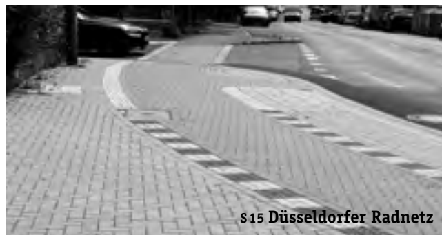
s 15 Düsseldorfer Radnetz