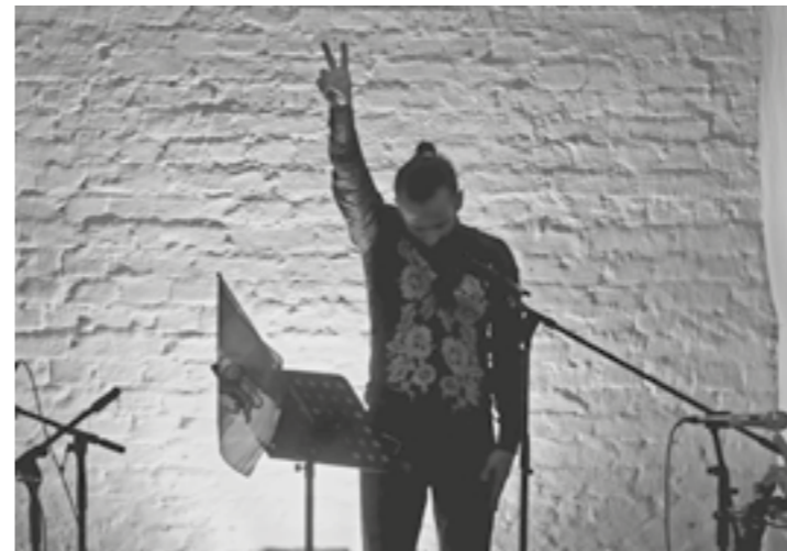
Aria performt bei seinem persischen Konzert

Am 17. Juni und am 7. August fanden Michaels „Einfach Feiern-Techno/Goa/psychedelic Trance“ Partys statt. Der Veranstalter erfreute sein tanzbegeistertes Publikum mit rhythmischen Playlists.