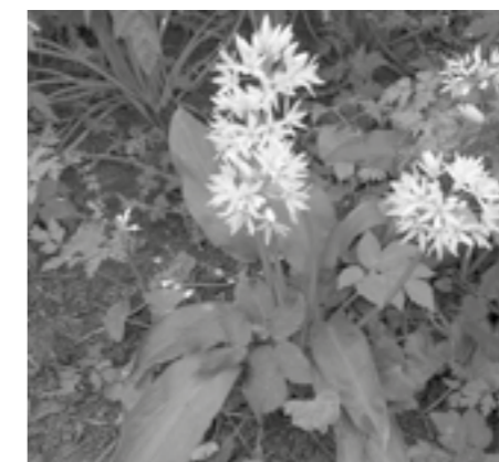
Blühender Bärlauch, Blätter und Blüte sind schön scharf