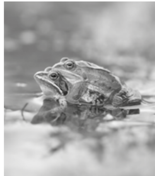
und mit seinen Moorfröschen

Moortanzen, oder den Moorfröschen, die sich himmelblau färben und in den lebensfeindlich scheinenden Moorgewässern ihre Heimat haben. Diese und viele Arten mehr, die für unsere Artenvielfalt so wichtig sind, stellt sie uns an diesem Abend vor.