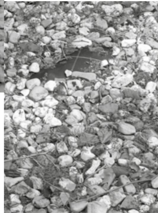
Hier mal Kies auf Folie

Merkwürdig ist 2000 die Aufzählung von begrünen und bepflanzen, 2018 und 2023 sogar die Unterscheidung von begrünen oder bepflanzen. Das hat wohl dazu eingeladen, Pflanzen in Töpfe zu „pflanzen“ und damit die Schotterfläche punktuell zu „begrünen“, oder auch einzelne Sträucher durch ein Loch in der Folie in die Erde zu setzen. Das alles soll nun mit dem expliziten Ausschluss von „Schotterung“ und „Kunstrasen“ verhindert werden. Kunstrasen habe ich bisher noch in keinem Vorgarten ent-