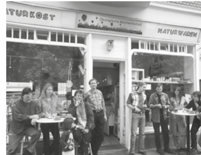
Koopler vor der Ökoma