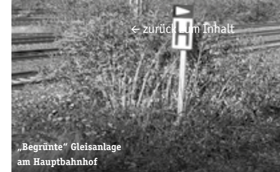
„Begrünte“ Gleisanlage am Hauptbahnhof