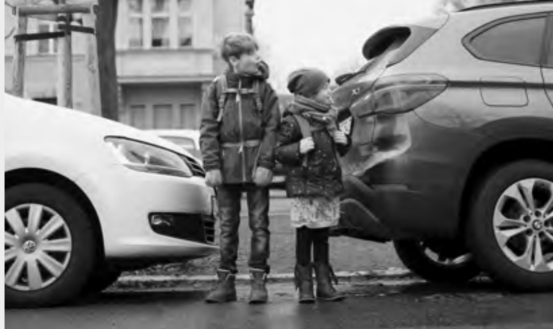
Kinder auf dem Weg zur Schule

Monatliche Treffen an jedem dritten Dienstag im Wechsel als Videokonferenz und Präsenzzusammenkunft. Anmeldung: jost@vcd-duesseldorf.de